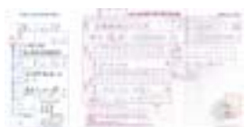
第一回義援金（振込受取書）