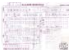
第二回義援金（振込受取書）